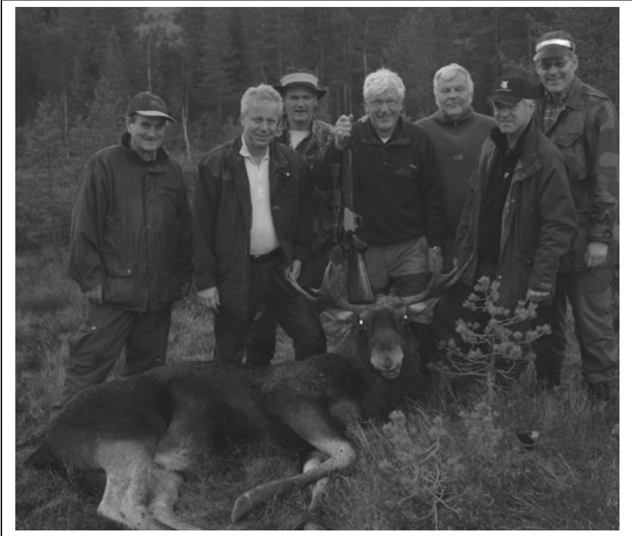
Skydeselskapet Sjurderudsætra med høstens trofé.

Retur: Jostein Løne Gråbrødreveien 4D 0379 Oslo