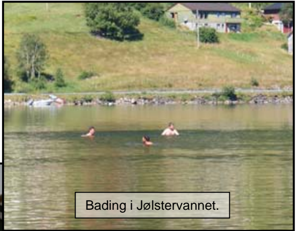
Bading i Jølstervannet.

Det er ikke bare skyting på et Landsskytterstevne. De fleste skytterne har med familien og tar det som en ferietur. Da blir det bading, soling, sykling og andre vanlige ferieaktiviteter.