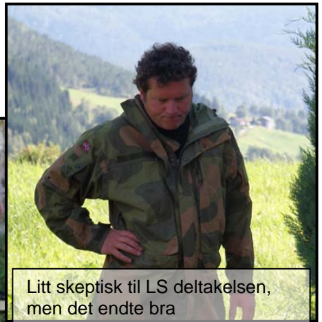
Litt skeptisk til LS deltakelsen, men det endte bra