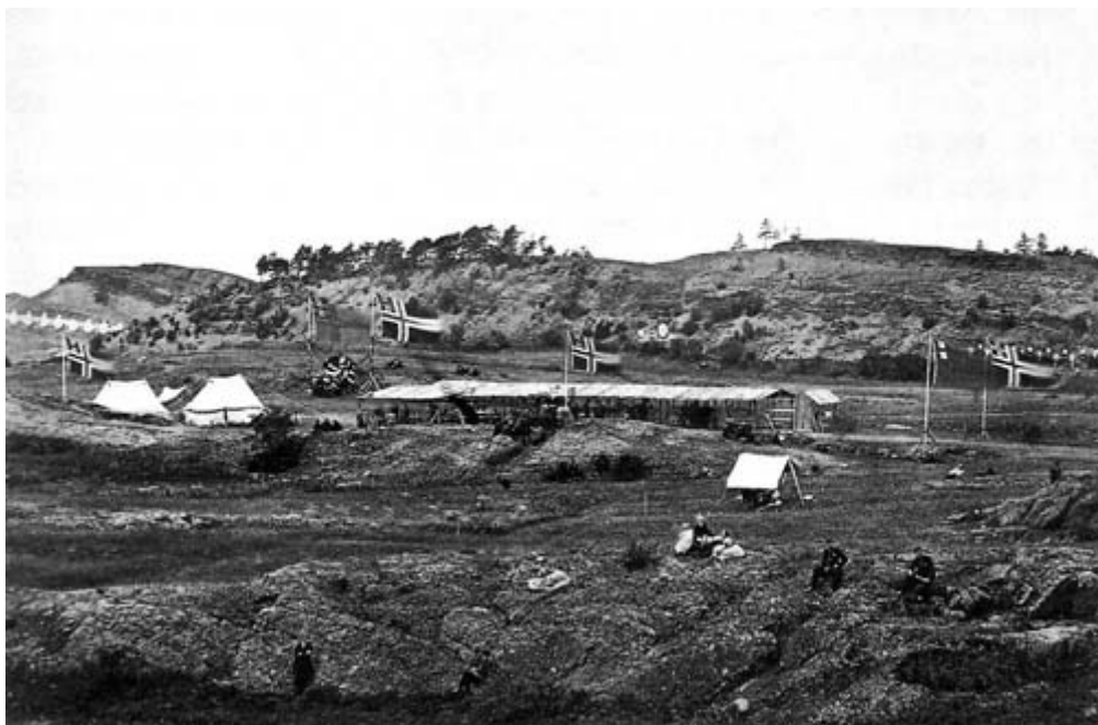
Skarpskyttens bane på Lindøya i de første årene.