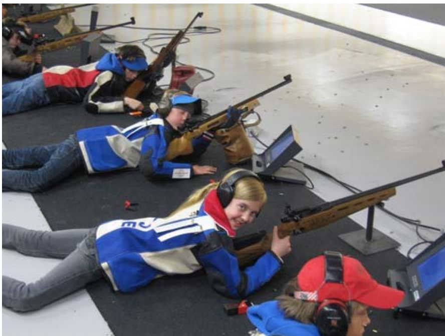
Ungdomssamling på Årvoll.

Nr. 1 - 2010 – årgang 14 Medlemsblad for Skydeselskabet Skarpskytten