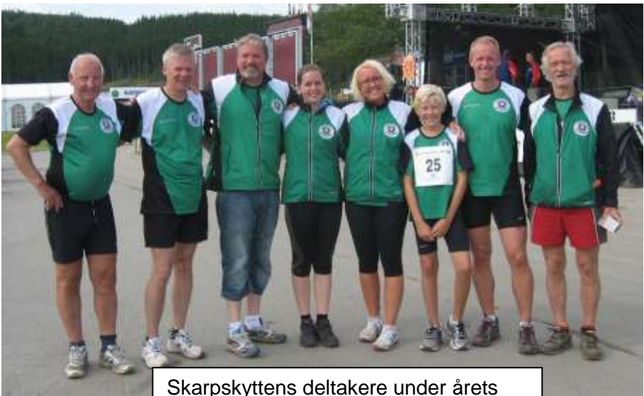
Skarpskyttens deltakere under årets NM i skogsløp med skyting i Bodø.

Utgiver: Skydeselskapet Skarpskytten Redaksjon: Jostein Løne, Even Haugvik og Kai Magne Mauseth