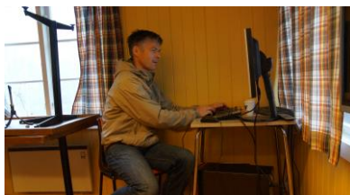
Even med stevestyring

Det kommer til å bli arrangert førstehjelpskurs på Løvenskioldbanen i løpet av våren. Fokus blir jegerskyting skader: stoppe blødning fra kikkerøyer, skader som kan oppstå fra hjemmelading osv