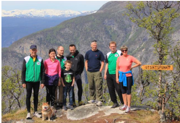
Frå turen i 2014

Vestlandsturen i 2012 er omtalt i tidligere nummer av Rifleposten, den er dokumentert, men dei to siste reisene lever som minne hjå deltakarane.