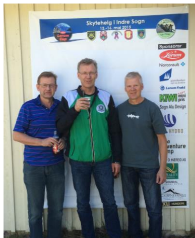
Frå turen i 2015

Veret var mot oss siste dagen så den planlagde fjellturen vart erstatta med befaring av Vindhellavegen og Borgund Stavkyrkje. Motbakke og stive bein var bytta ut med norsk veghistorie og 900 år gammalt trebygg.